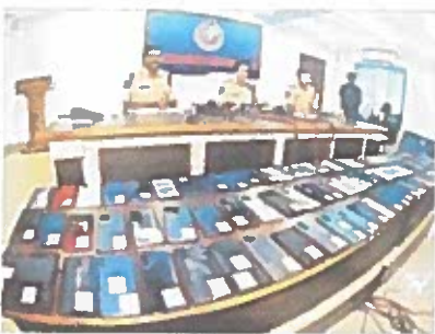
స్టాంబం చేసుకున్న మొబైల్ ఫోన్ల వ్యాపార లభ్యతలు