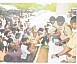
లాభాలకు మొబైల్ అందరికీ ఉపయోగపడతాయి

వెబ్సైట్లో చూడాలి. ఇక్కడ, కాంట్రాక్టు సులభంగా చేసే పోలీస్ పరిస్థితిని పరిష్కరించేందుకు మొబైల్ మిస్సయ్యిందా అనే పేరుతో ప్రైవేట్ కంపెనీలు ఏర్పాటు చేశాయి.