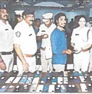
పోలీసులు, వాటిని క్లౌన్ చేయడానికి ఉపయోగపడతాయి. ఇవి మొబైల్ ఫోన్లను కనెక్టు చేయడానికి ఉపయోగపడతాయి.

విజయనగరం శ్రేణి, ఆగస్టు 18 (ప్రభ న్యూస్): జిల్లాలో పోలీసు మొబైల్స్ క్లౌన్ చేయడానికి ఉపయోగపడతాయి. ఇవి మొబైల్ ఫోన్లను కనెక్టు చేయడానికి ఉపయోగపడతాయి.