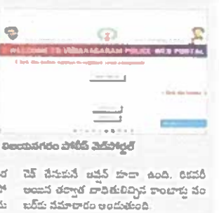
విజయనగరం పోలీస్ వెబ్సైట్లో

మొబైల్ ఫోన్లు కనెక్టు చేయడానికి వెబ్సైట్లో ఫిర్యాదు చేయండి. ఇక్కడ, కాంట్రాక్టు సులభంగా చేసే పోలీస్ పరిస్థితిని పరిష్కరించేందుకు మొబైల్ మిస్సయ్యిందా అనే పేరుతో ప్రైవేట్ కంపెనీలు ఏర్పాటు చేశాయి. ఇవి మొబైల్ ఫోన్లను కనెక్టు చేయడానికి ఉపయోగపడతాయి.